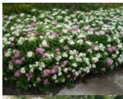
Spiraea japonica 'Genpei' medvejka

Habitus: listopaden grm, goste rasti z pokončnimi poganjki, h: 1m, š: 1.5m, cvet: rdeč-lila (junij/julij/avgust)