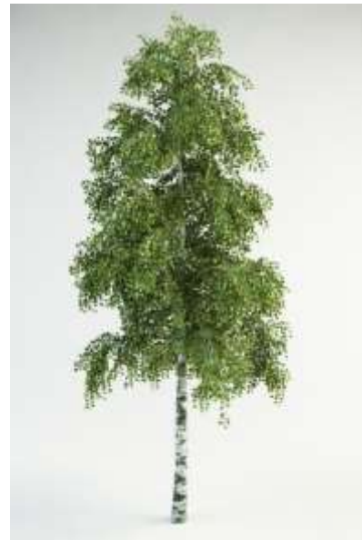
Betula pendula navadna breza

Habitus: listopadno drevo, ovalne krošnje, h: do 20m, š: do 7m; bela skorja