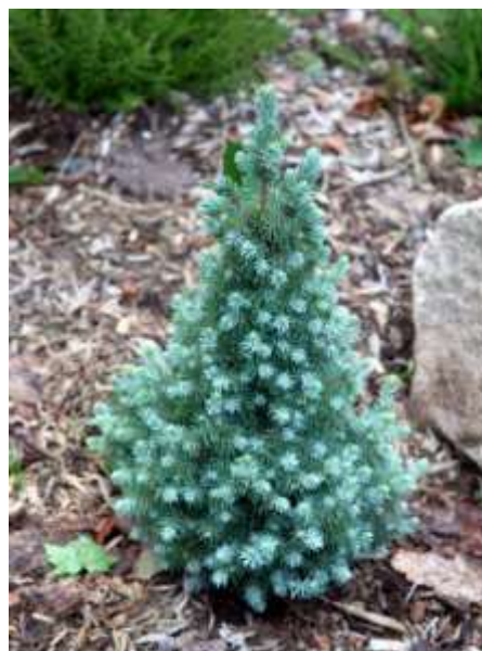
Picea glauca 'Blue Wonder'

Habitus: iglavec izrazito stožčaste rasti, h: 2m, š: 1m,