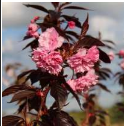
Prunus s. 'Royal Burgundy' Rdeča japonska češnja

Habitus: listopadno drevo, lijakaste rasti, h: 6-8m, š: 4-6m; cvet: svetlo roza (april, maj)