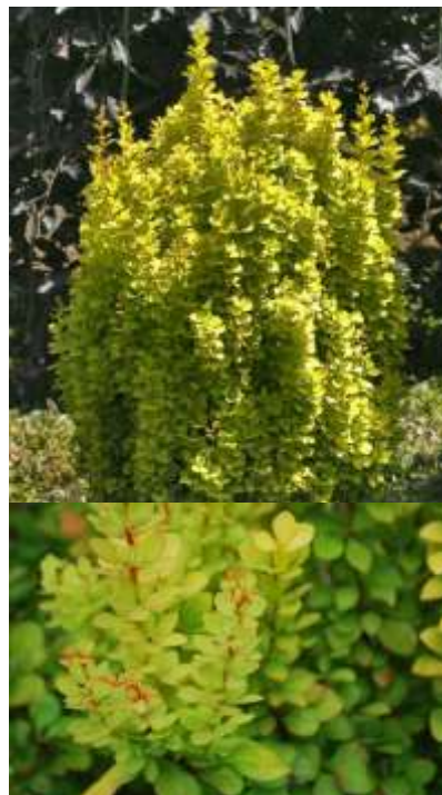
Berberis th. 'Gold torch' Rumeni japonski češmin

Habitus: listopadni več debelni grm, h: do 1m, š: do 0,6m; zlatorumeni listi