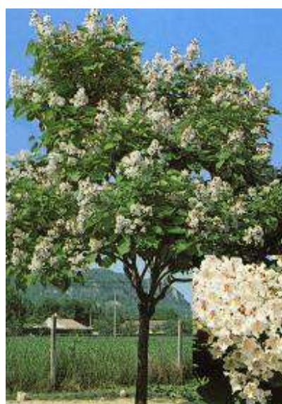
Catalpa bignonioides cigarovec

Habitus: listopadno drevo, razprostrte krošnje h: 10-15m, š: 6-10m; cvet: bel+rumene in škrlatne lise, plod: dolgi viseči valjasti stroki