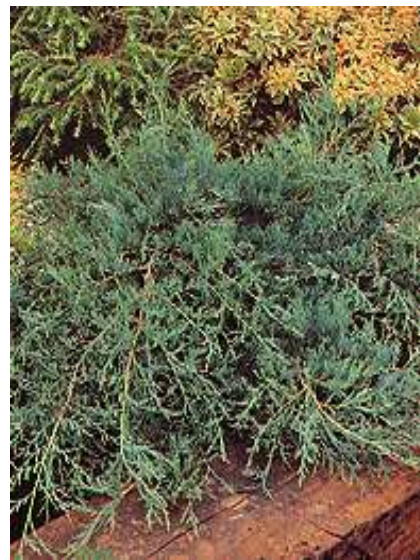
Juniperus virginiana 'Grey owl' brin

Habitus: grmast iglavec razprostrte rasti, h: 0.5m, š: 1.5m,