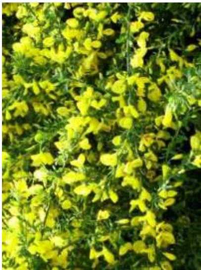
Cytisus scoparius 'Luna' relika

Habitus: listopaden grm, z lokastimi vejami, h: do 2m, š: do 1.5m; cvet: rumen, plod: temno siv strok