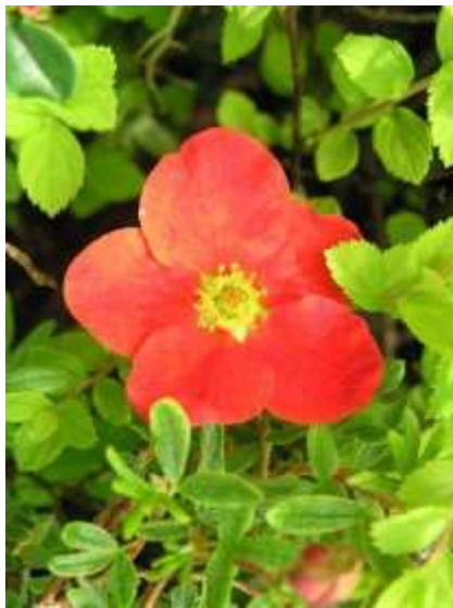
Potentilla fruticosa 'Red ace' petoprstnik

Habitus: listopaden grm, košate rasti, h: 0.5m, š: 0.5m; cvet: rdeč (junij-september)