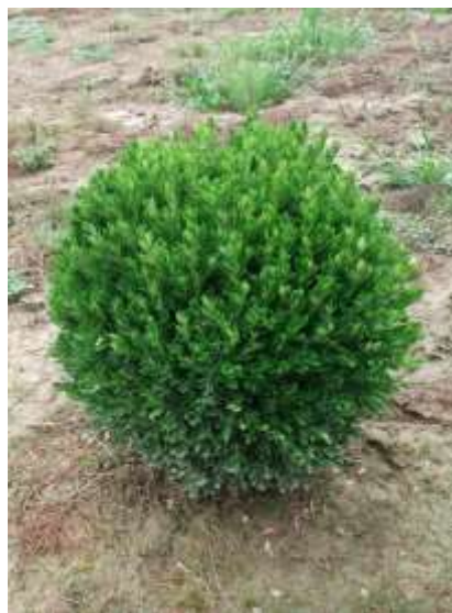
Buxus pumila nana kroglasti pušpan

Habitus: zimzelen grm z bite kroglaste rasti h: 0,5-1m, š: 0,5-1m;