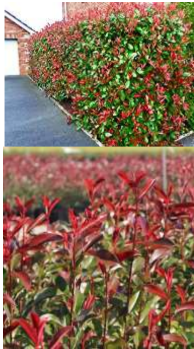
Photinia x fra. 'Red Robin' fotinja

Habitus: zimzelen grm, pokončne, košate rasti, h: 3m, š: 2m; cvet: bel