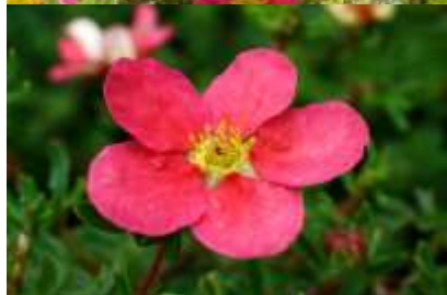
Potentilla fruticosa 'Danny boy' petoprstnik

Habitus: listopaden grm, košate rasti, h: 0.5-0.8m, š: 0.5-0.8m; cvet: rdeče-roza (junij- september)