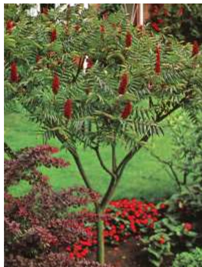
Rhus typhina octovec

Habitus: listopadno drevo, redke krošnje, h: 6m, š: 5m,