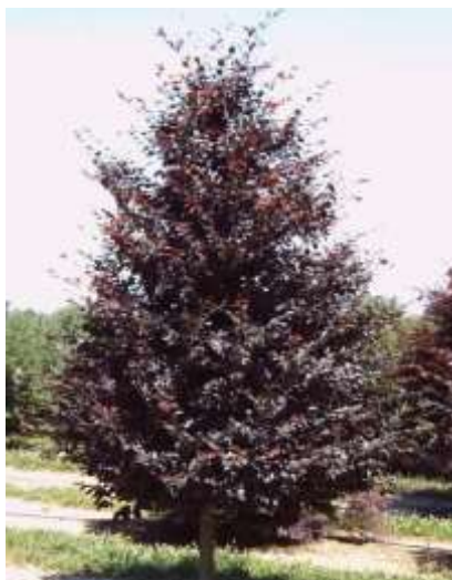
Fagus sylvatica 'Riversii' Rdečelistna bukev

Habitus: listopadno drevo, široke krošnje, h: 10-12m, š: 8-10m;