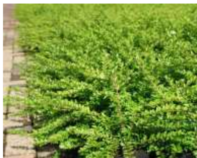
Lonicera n. Maigrun kostoničevje

Habitus: delno zimzelen grm, goste in košate krošnje, h: 0.8m, š: 0.8m; cvet: bel, plod: lila