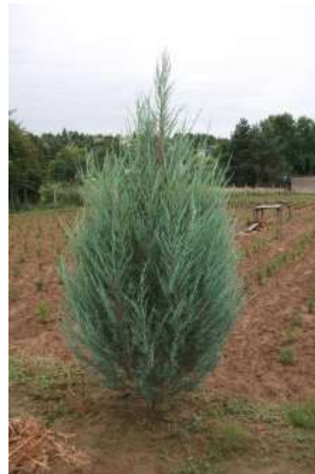
Juniperus scop. 'Skyrocket' brin

Habitus: pokončen iglavec stebraste rasti, h: 6m, š: 1m,