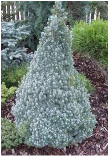
Picea glauca 'Sanders blue'

Habitus: iglavec izrazito stožčaste rasti, h: 2m, š: 1m,