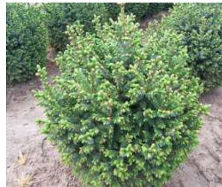
Picea omorika 'Nana' pritlikava omorika

Habitus: iglavec široke stožčaste rasti, h: 2m, š: 2m,