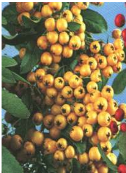
Pyracantha c. 'Solei d'or' ognjeni trn

Habitus: delno zimzeleni grm, pokončne zbite rasti, h: 3m, š: 3m, cvet: bel (junij), plod: rumen