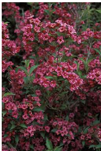
Weigela 'Newport Red' vajgela

Habitus: listopaden grm, razprostrte pokončne rasti, h: 3m, š: 3m, cvet: škrlatno do lila-rdeč (junij/julij)