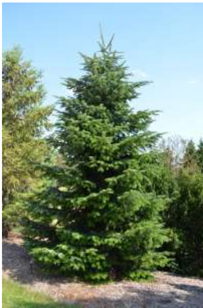
Abies nordmanniana kavkaška jelka

Habitus: iglasto drevo, temno zelene iglice spodaj z belima listnima žilama, h: 25m, š: 6m,