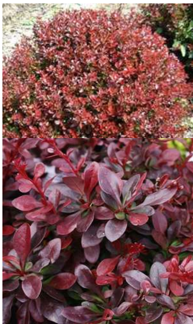
Berberis th. 'Atropurpurea nana' nizek rdeči japonski češmin

Habitus: listopadni več debelni grm, h: do 1m, š: do 0.7m; rumeno rdeči cvet (april/maj)