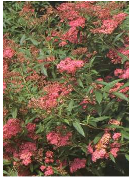
Spiraea bumalda 'Antony waterer' medvejka

950566 60-80cm 15,00€ 950567 80-100cm 18,00€