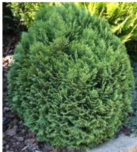
Chamaecyparis I. 'Little Champion' pacipresa

Habitus: kroglasti iglavec počasne rasti, h: 0.8m, š: 0.8m,