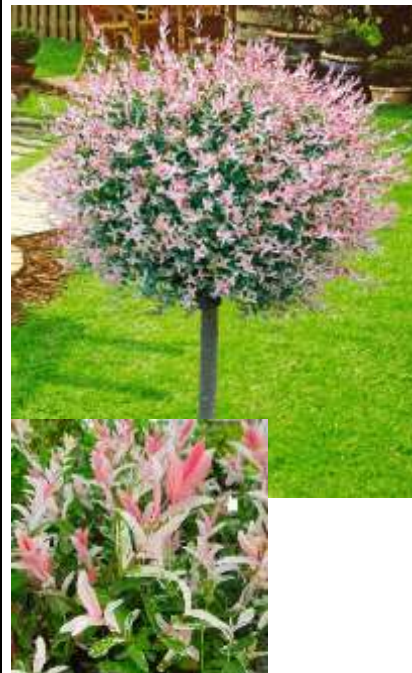
Salix int. hakuro nishiki pisanolistna vrba

Habitus: listopaden grm, goste razprostrte rasti, h: 1.5-2.5m, š: 2-2.5m,