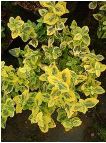
Euonymus fortunei 'Emerald'n gold' plazeča trdoleska

Habitus: zimzelen plazeči grm, h: do 0.8m, š: do 1.5m