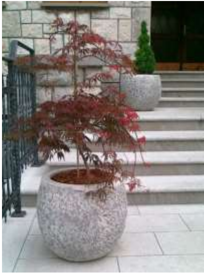
Acer pal. dissectum 'Atropurpureum' pahljačasti javor

Habitus: listopadno drevo, povešena dežnikasta krošnja, h: 2m, š: 3m;