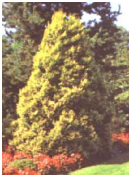
Chamaecyparis p. 'Plumosa aurea' pacipresa

Habitus: pokončen iglavec počasne kompaktne rasti , h: 10m, š: 3m,