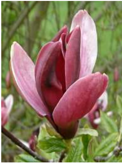
Magnolia liliflora nigra