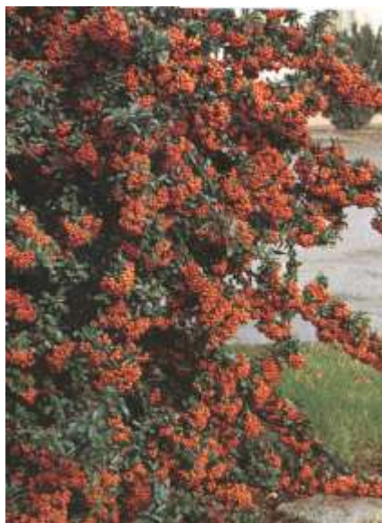
Pyracantha c. 'Orange glow' ognjeni trn

Habitus: delno zimzeleni grm, pokončne zbite rasti, h: 3m, š: 3m, cvet: bel (junij), plod: oranžen