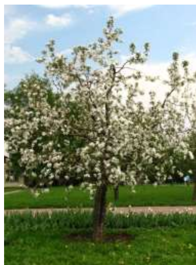
Malus domestica divja jablana

Habitus: listopadno drevo, goste in košate rasti, h: 8m, š:6m;