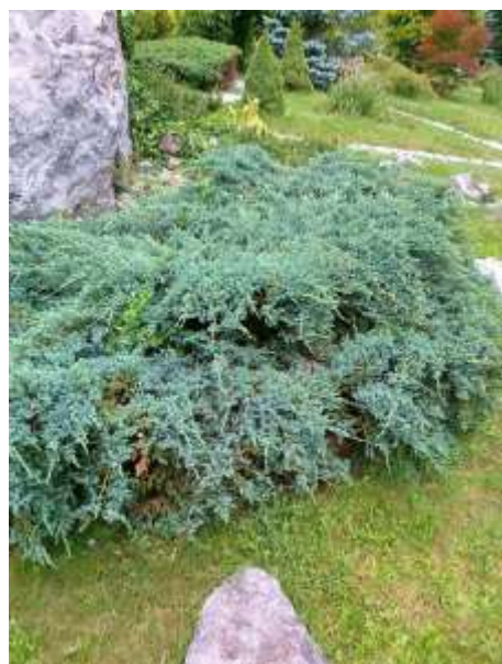
Juniperus squamata 'Blue carpet' brin

Habitus: plazeč iglavec razprostrte rasti, h: 0.4m, š: 1.5m,