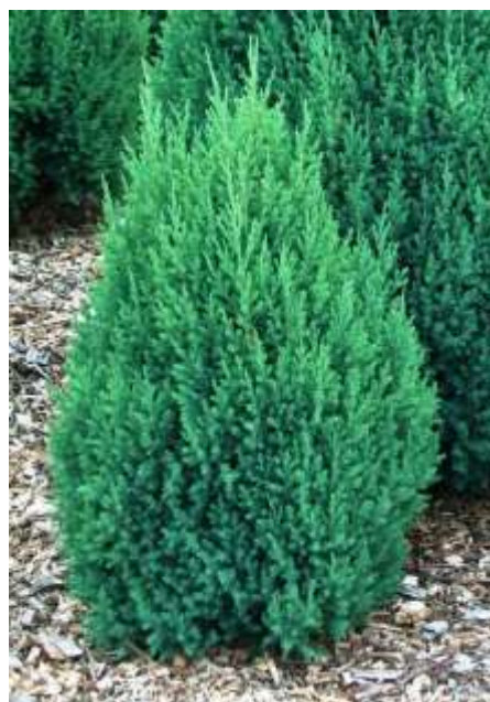
Juniperus media 'Stricta ' brin

Habitus: grmast iglavec valjaste rasti, h: 2m, š: 1m,