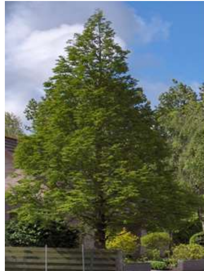
Metasequoia glyptostroboides metasekvoja

Habitus: hitro rastoč listopaden iglavec, z redkimi vejami in stožčasto krošnjo, h: 30m, š: 10m,