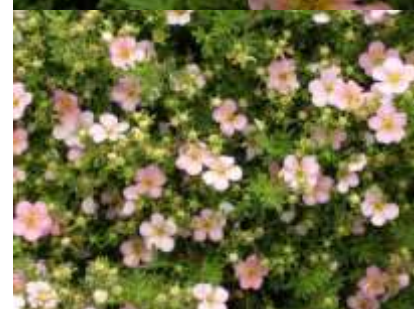
Potentilla fruticosa 'Pink Whisper' petoprstnik

Habitus: listopaden grm, košate rasti, h: 0.5m, š: 0.5m; cvet: rdeč (junij-september)