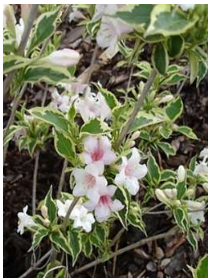
Weigela florida 'Nana variegata' vajgela

Habitus: listopaden grm, razprostrte pokončne rasti, h: 1.5m, š: 1.5m, cvet: temno roza (junij/julij)