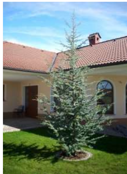
Cedrus atlantica 'Glauca' modra atlaška cedra

Habitus: iglasto drevo, redka stožčasta asimetrične krošnje, h: 15m, š: 9m,