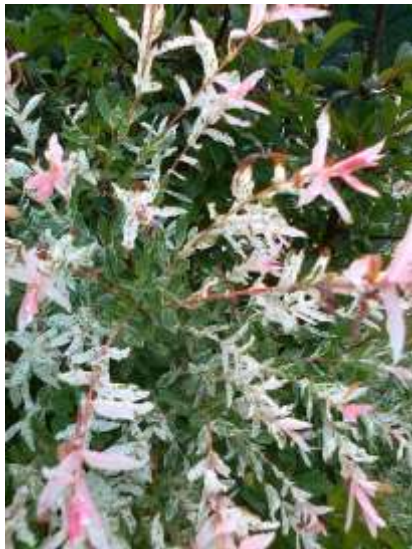
Salix integra hakuro pisanolistna vrba

Habitus: listopaden grm, goste razprostrte rasti, h: 2.5m, š: 2m,