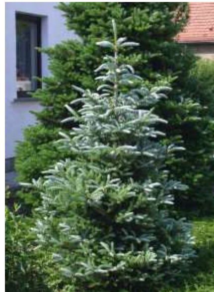
Abies koreana 'Silberlocke' korejska jelka

Habitus: iglasto drevo, temno zelene iglice s spodnjo srebrno stranjo, iglice se zavijajo navzgor, h: 6m, š: 3m,