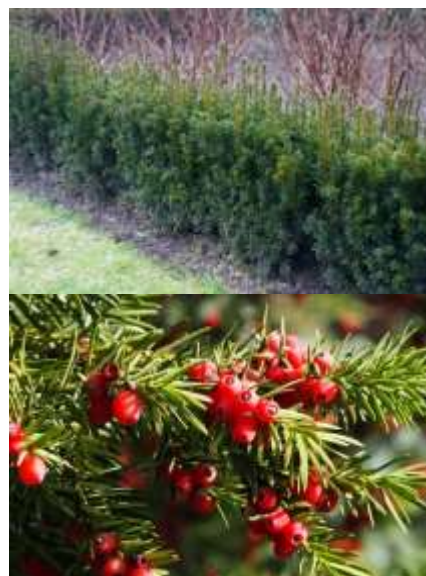
Taxus media 'Hicksii' stebrasta tisa

Habitus: iglavec stebraste rasti, h: 3-4m, š: 1.0-3.0m, Lega: svetla senca, polsenca