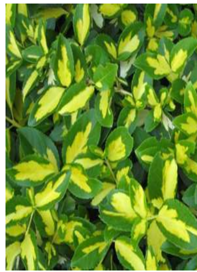
Euonymus jap. 'Aureopictus' japonska trdoleska

Habitus: zimzelen plazeči grm, h: do 1.5m, š: do 1.5m