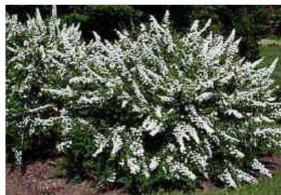
Spiraea nipponica 'Snowmound' medvejka

Habitus: listopaden grm, goste rasti z lokastimi poganjki, h: 2m, š: 2m, cvet: bel (april/maj)