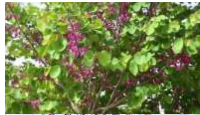
Cercis siliquastrum Judeževo drevo Navadni jadicovec

Habitus: listopadni vzpenjavi grmi ali nižja drevesa do 10m cvet: rožnat/lila