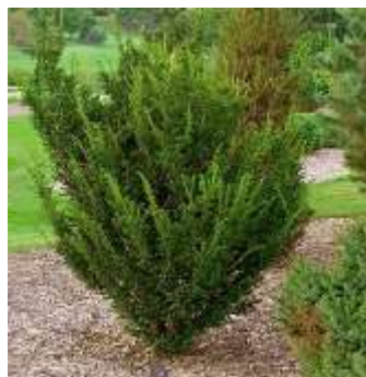
Taxus baccata tisa

Habitus: manjše iglasto drevo ali višji grm , h: 10 m, š: 8m,