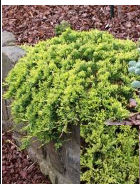
Juniperus squamata 'Golden carpet' brin

Habitus: plazeč iglavec razprostrte rasti, h: 0.3m, š: 1m,