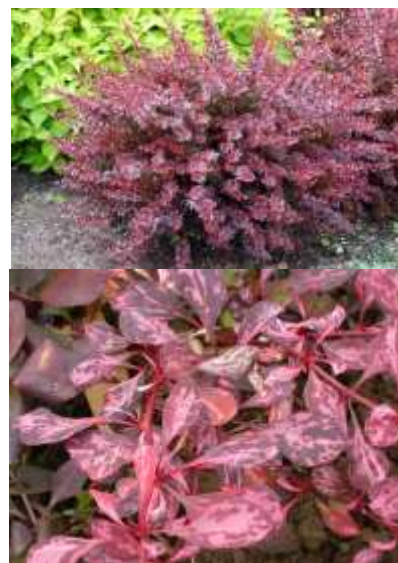
Berberis th. 'Harlequin' pisan rdeči japonski češmin

Habitus: listopadni več debelni grm, h: do 1m, š: do 1m; rumeno rdeči cvet (april/maj)