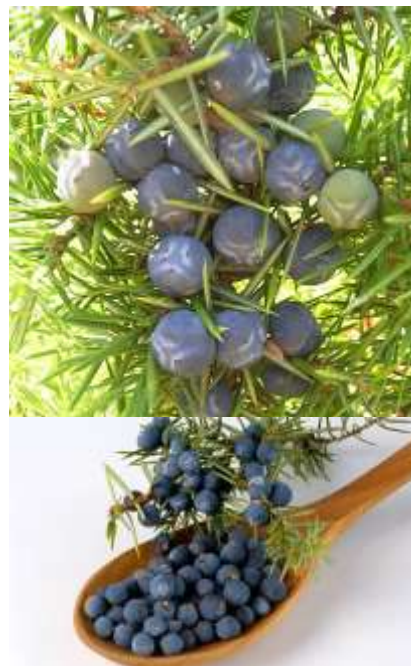
Juniperus comunis navadni brin

Habitus: pokončen iglavec valjaste rasti, h: 3-5m, š: 2m,