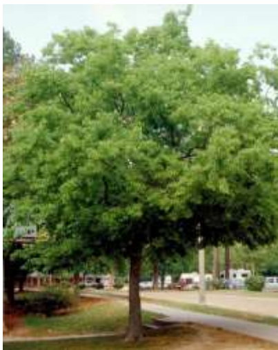
Celtis australis Navadni koprivovec

Habitus: listopadno drevo, ki zraste v višino do 10m