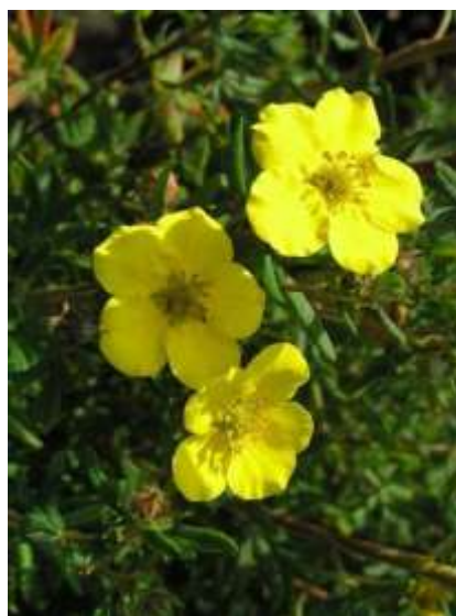
Potentilla fruticosa 'Goldfinger' petoprstnik

Habitus: listopaden grm, košate rasti, h: 1.2m, š: 1.2m; cvet: rumen (junij-september)