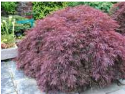
Acer pal. dissectum 'Garnet' pahljačasti javor

Habitus: listopadno drevo, povešena dežnikasta krošnja, h: 1-2m, š: 2-3m;