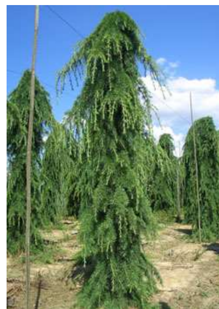
Cedrus d. 'Pendula' povešava himalajska cedra

Habitus: iglasto drevo, goste široke stožčaste krošnje s povešanimi vejami, h: 4-6m,