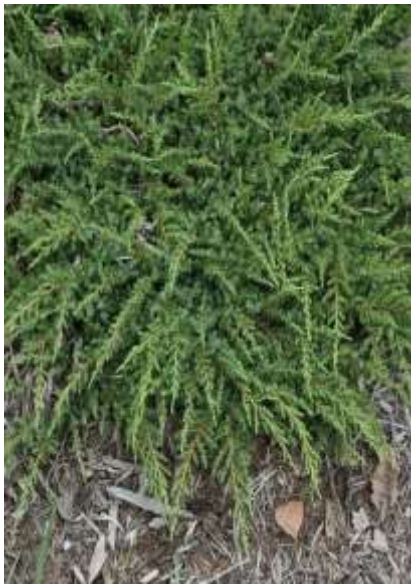
Juniperus squamata 'Green carpet' brin

Habitus: plazeč iglavec razprostrte rasti, h: 0.3m, š: 1m,