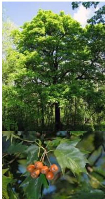
Sorbus torminalis brek

Habitus: listopadno drevo, redke pokončne krošnje, h: 20m, š: 10m,