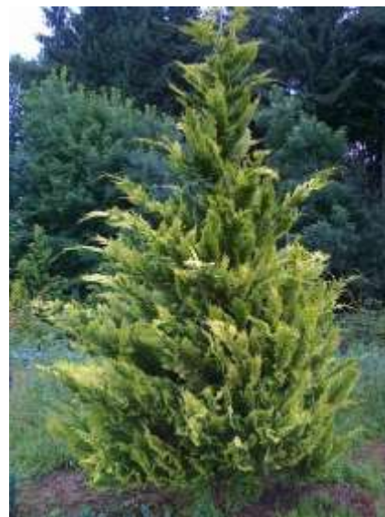
Chamaecyparis l. 'Kelleri's Gold' pacipresa

Habitus: pokončen iglavec hitre rasti z ozko stebrasto krošnjo, h: 3m, š: 0.6-1m,