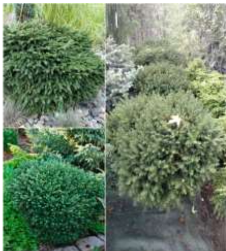
Picea omorika 'Karel' pritlikava omorika

Habitus: iglavec grmičaste rasti, h: 0,5-0,8m, š: 1,2m,