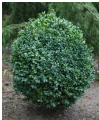
Buxus sempervirens pušpan

Habitus: zimzelen grm z bite ovalne rasti