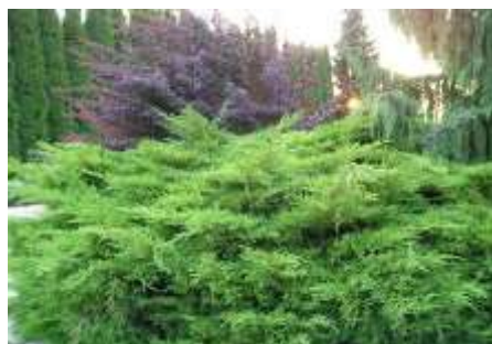
Juniperus media 'Pfitzeriana ' brin

Habitus: grmast iglavec razprostrte rasti, h: 2.5m, š: 2m,