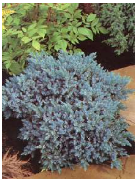
Juniperus squamata 'Blue star' brin

Habitus: kompakten grmast iglavec, počasne rasti, h: 0.5m, š: 0.6m,