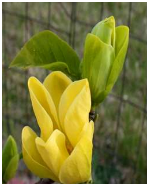
Magnolia brooklynensis 'Yellow River'