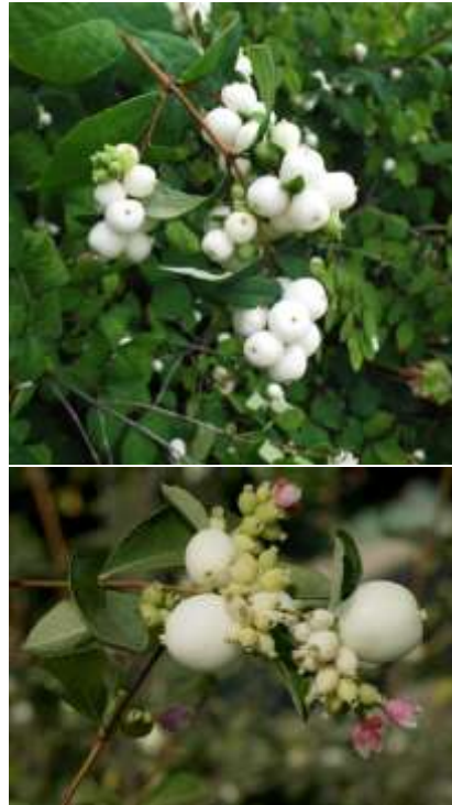
Symphoricarpos rac. pokovec

Habitus: listopaden grm, goste rasti, h: 2m, š: 2m, cvet: bel (april/maj), plodovi: beli do rožnati