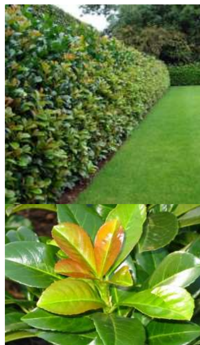
Prunus laurocerasus 'Etna' širokolistni lovorikovec

Habitus: zimzeleni grm, goste zbite rasti, h: 2-3m, š: 2m, cvet: bel, mladi listi rahlo bakreni