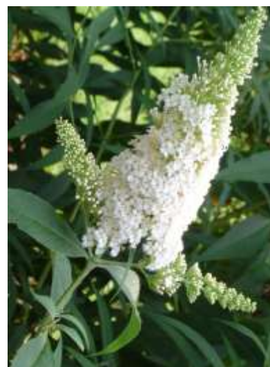
Buddleja davidii 'Peace' budleja

Habitus: grmovnica z dolgimi poleglimi poganjki h: do 3m, š: do 3m;