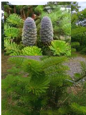
Abies koreana korejska jelka

Habitus: iglasto drevo, rahlo stožčaste rasti (veje izraščajo vodoravno); h: 10m, š: 4m,