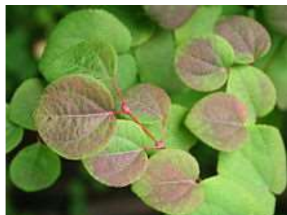
Cercidiphyllum japonicum Cercidifil, katsura

Habitus: listopadni več debelni grmi ali nižja drevesa višine 10m