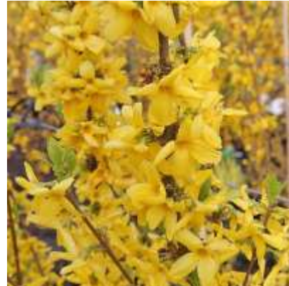
Forsythia int. 'Goldrusch' forzicija

Habitus: listopaden grm, pokončne rasti, h: do 3m, š: do 3m; cvet: rumen