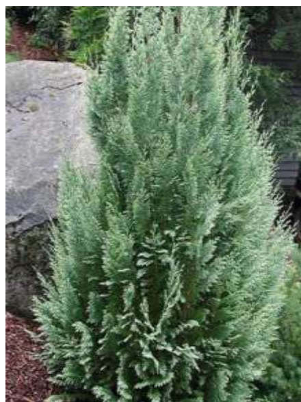
Chamaecyparis 'White spot' pacipresa

Habitus: pokončen iglavec počasne kompaktne rasti , h: 3m, š: 1m,