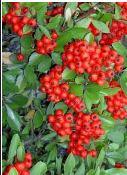
Pyracantha c. 'Red column' ognjeni trn

Habitus: delno zimzeleni grm, pokončne zbite rasti, h: 3m, š: 3m, cvet: bel (junij), plod: rdeč