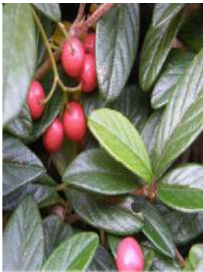
Cotoneaster salicifolius 'Parkteppich' vrbolistna panešpljica

Habitus: vednozelen gram, h: do 0.5m, š: do 2m; cvet: bel, plod: rdeč