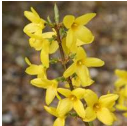
Forsythia int. Lynwood' forzicija

Habitus: listopaden grm, pokončne rasti, h: do 3m, š: do 3m; cvet: rumen