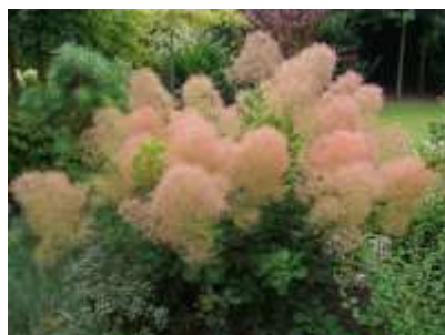
Cotynus coggygia 'Young lady' ruj

Habitus: listopaden grm, razprostrte rasti, h: do 2m, š: do 2m; cvet: rumeno zelen - metlast