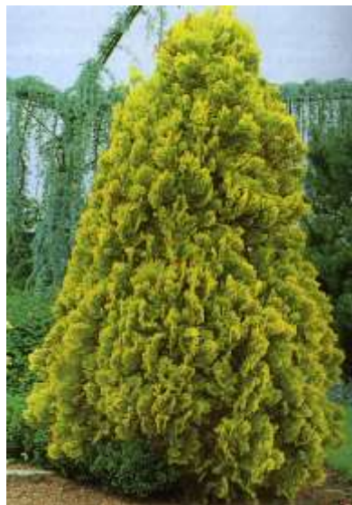
Thuja orientalis 'Aurea' klek

Habitus: iglavec simetrične stožčaste počasne rasti, h: 2-4m, š:0.8-1.5m,