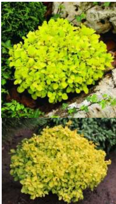
Berberis th. 'Tiny gold' Rumeni japonski češmin

Habitus: listopadni več debelni kroglasti grm, h: do 0,5m, š: do 0,5m; rumeno rdeči cvet (april/maj)