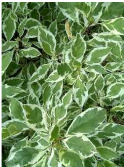
Cornus alba 'Elegantissima' dren

Habitus: listopaden grm, razprostrte rasti, h: do 3m, š: do 3m; cvet: zeleno bel; zeleno beli listi, rdeča stebila