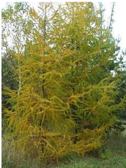
Larix decidua macesen

Habitus: hitro rastoč listopaden iglavec, z redkimi vejami in sprva stožčasto krošnjo, h: 25m, š: 10m,