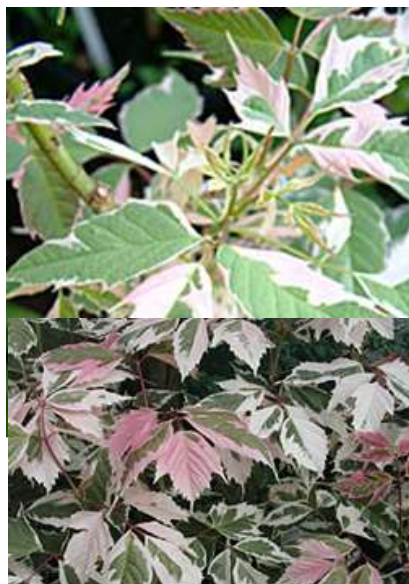
Acer negundo 'Flamingo' ameriški javor

Habitus: listopadno drevo razprostrte krošnje, h: 5-7m, š: 4-6m; listi belo zeleni