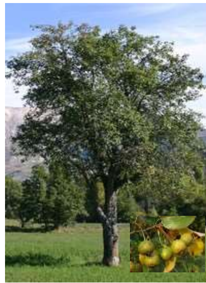
Pyrus pyraeaster divja hruška

Habitus: listopadno drevo, razprostrte rasti, h: 5-7m, š: 3-6m; cvet: bel (april)