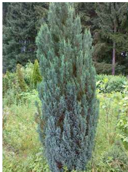
Chamaecyparis l. 'Ellwoodii' pacipresa

Habitus: pokončen iglavec počasne rasti z ozko stebrasto krošnjo, h: 3m, š: 0.6-1m,