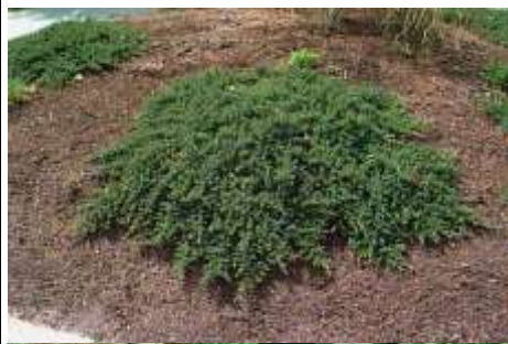
Juniperus media 'Procumbens nana' brin

Habitus: grmast iglavec valjaste rasti, h: 0.3m, š: 1m,