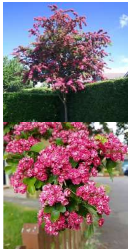
Crataegus l. 'Paul's scarlet' glog

Habitus: listopaden grm ali nižje drevo, h: 4-6m, š: 3-4m; cvet: škrlaten; zeleni listi,