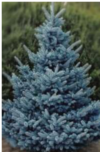
Picea pungens 'Blue Diamond' bodičasta smreka

Habitus: iglavec široke stožčaste rasti, h: 8m, š: 4m,