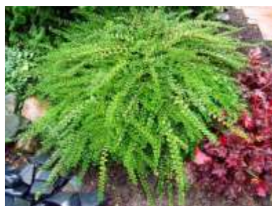
Lonicera n. Pileata kostoničevje

Habitus: delno zimzelen grm, goste in košate krošnje, h: 1m, š: 1m; cvet: bel, plod: lila