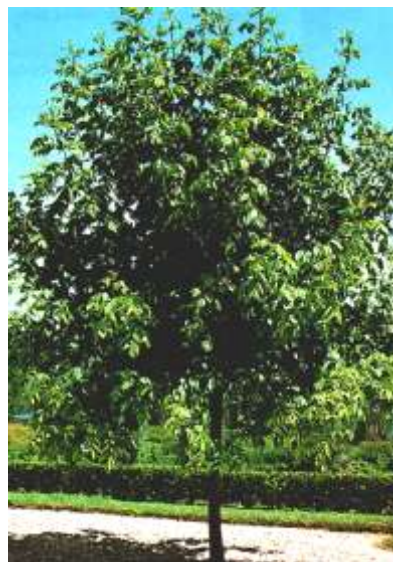
Acer negundo ameriški javor

Habitus: listopadno hitro rastoče drevo razprostrte krošnje, h: 15m, š: 10m