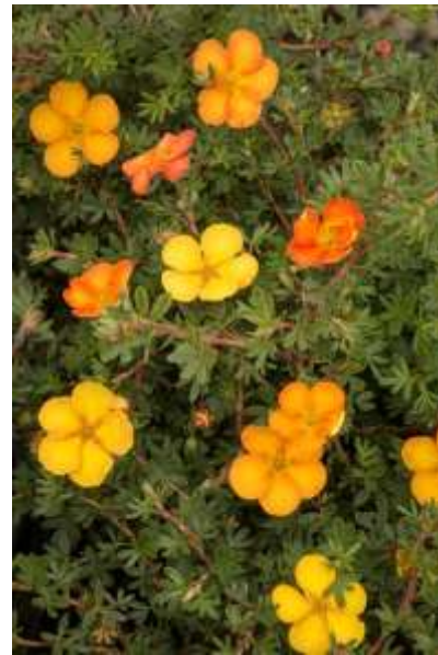
Potentilla fruticosa 'Sunset' petoprstnik

Habitus: listopaden grm, košate rasti, h: 1m, š: 1m; cvet: rumeno oranžna (junij-september)