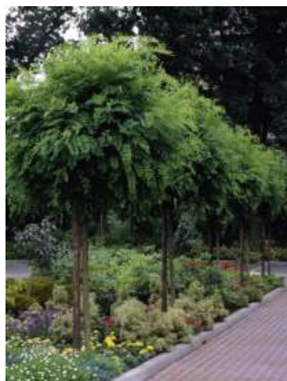
Robinia pseudoacacia 'Umbraculifera' robinija

Habitus: listopadno drevo, razprostrte redke krošnje, h: 5-6m, š: 4m, ne cveti