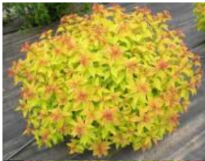
Spiraea japonica 'Gold flame' medvejka

Habitus: listopaden grm, goste rasti z pokončnimi poganjki, h: 1-1.2m, š: 1-1.2m, cvet: rožnat (junij/julij)