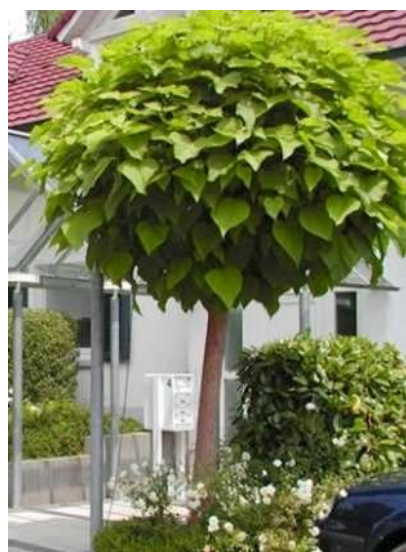
Catalpa bign.'Nana' cigarovec

Habitus: listopadno drevo, razprostrte krošnje h: 4-7m, š: 4-7m;