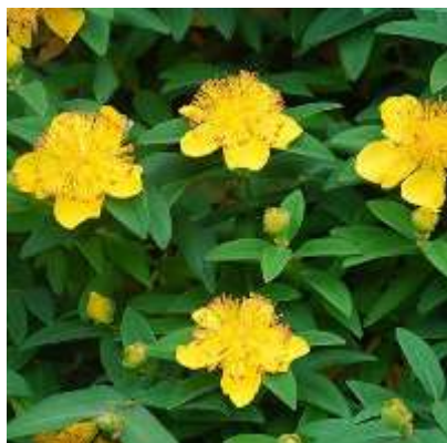
Hypericum calycinum krčnica

Habitus: listopaden grm v: 0,6m, š: 0,6m