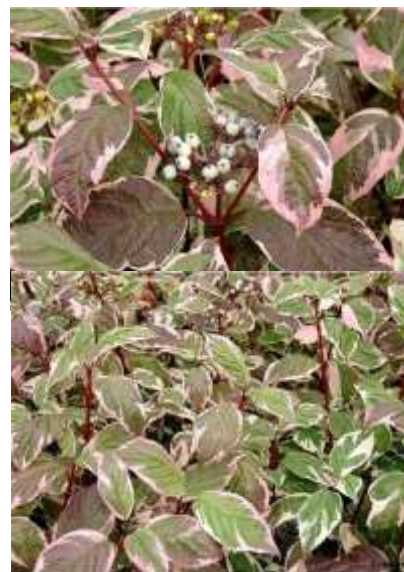
Cornus alba 'Sibirica variegata' dren

Habitus: listopaden grm, razprostrte rasti, h: do 3m, š: do 3m; cvet: zeleno bel; zeleno beli listi,