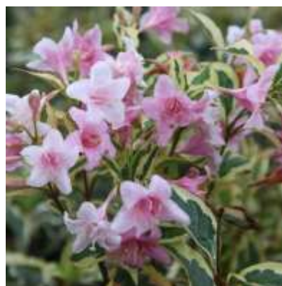
Weigela 'florida Variegata' vajgela

Habitus: listopaden grm, razprostrte pokončne rasti, h: 3.5m, š: 2.5m, cvet: temno roza (junij/julij)