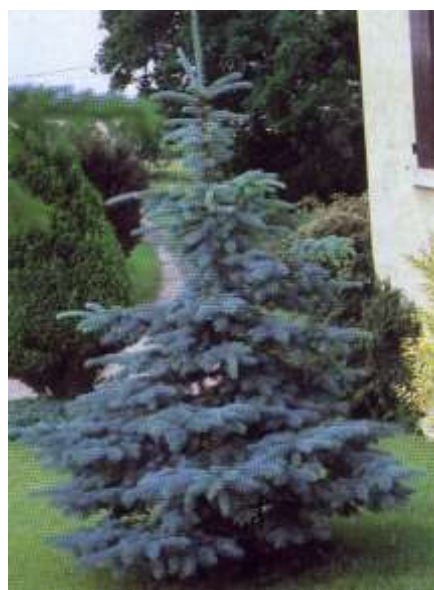
Picea pungens 'Koster' bodičasta smreka

Habitus: iglavec široke stožčaste rasti, h: 8m, š: 4m,