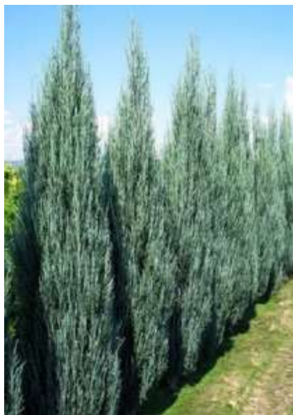
Juniperus scop. 'Blue arrow' brin

Habitus: pokončen iglavec stebraste rasti, h: 4-5m, š: 0,5-1m,