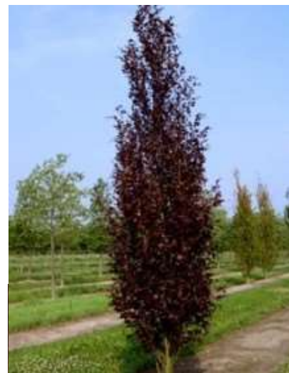
Fagus sylvatica 'Dawyck Purple' Rdeča stebrasta bukev

Habitus: listopadno drevo, stebraste krošnje, h: 8-10m, š: do 3m;