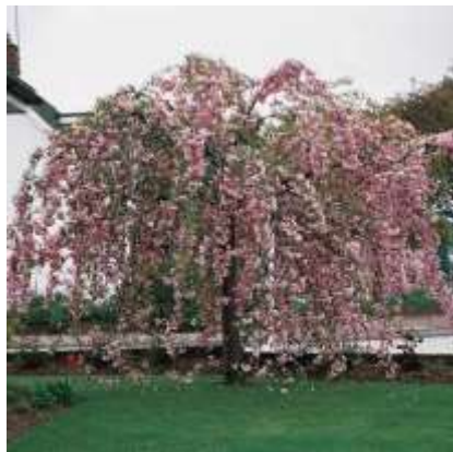
Prunus serulata 'Kikushidare-sakura' japonska češnja

Habitus: listopadno drevo, povešave krošnje, h: 3-5m, š: 3-4m; cvet: svetlo roza (april)