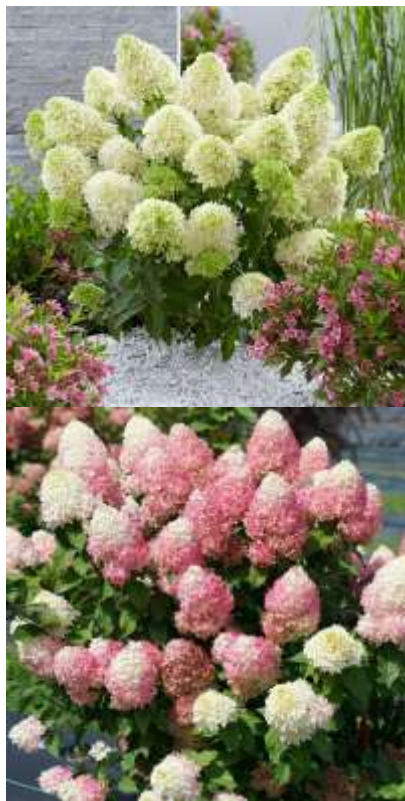
Hydrangea paniculata hortenzija