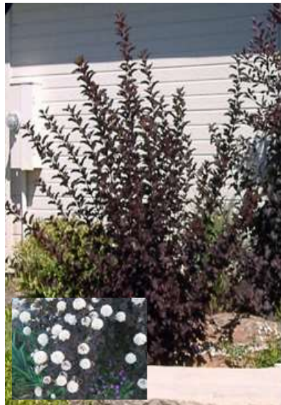
Physocarpus opulifolius 'Diablo' mehurjasti oslez

Habitus: listopaden grm, pokončne, košate rasti, h: 2-3m, š: 2-3m; cvet: roza (junij/julij)