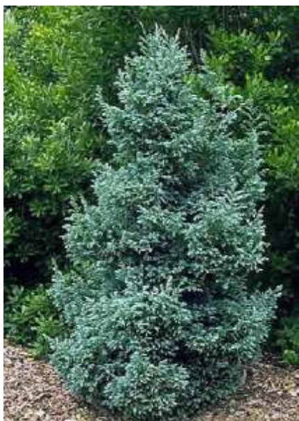
Chamaecyparis pisifera 'Boulevard' pacipresa

Habitus: pokončen iglavec počasne kompaktne rasti, h: 3m, š: 1.2-2m,