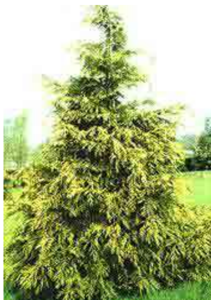
Chamaecyparis I. 'Westermanii' pacipresa

Habitus: pokončen kompakten iglavec s piramidalno, h: 8m, š: 3m,