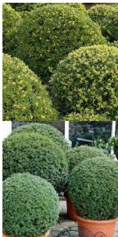
Ilex crenata 'Dark green' japonska bodika

Habitus: zimzelen stebrast grm h: do 0.8m, š: 0.8m;