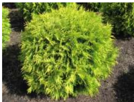
Thuja occidentalis 'Golden globe' kroglasti klek

Habitus: iglavec zbite kroglaste rasti, h: 1-1.5m, š: 1-1.5m,