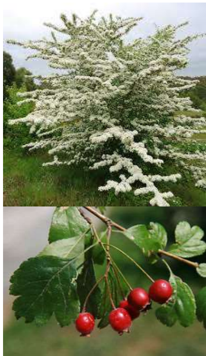
Crataegus laevigata glog

Habitus: listopaden grm ali nižje drevo, h: do 5m, š: do 5m; cvet: bel; zeleni listi,