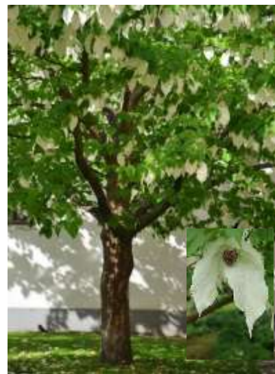
Davidia involucrata davidija

Habitus: listopadno drevo razprostrte krošnje, h: 6-12m, š: 4-8m;