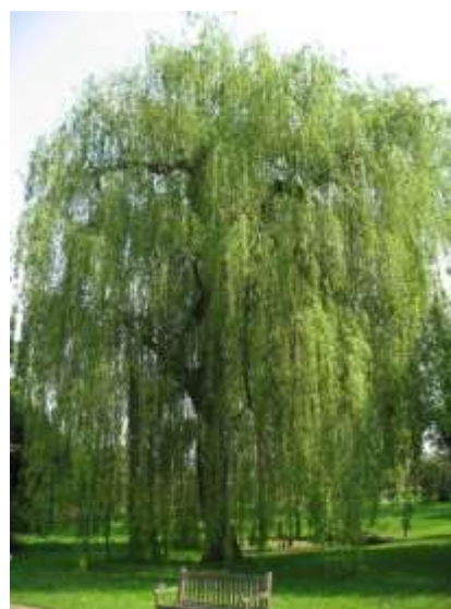
Salix babylonica vrba žalujka

Habitus: listopadno drevo, goste povešave krošnje, h: 12m, š: 10m,