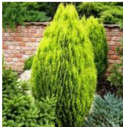
Thuja orientalis 'Aurea nana' klek

Habitus: iglavec simetrične stožčaste počasne rasti, h:1,2- 1,5m, š:1-1,2m,