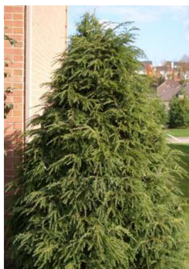
Tsuga canadensis kanadska čuga

Habitus: iglavec razvejane stožčaste rasti, h: 15-20m, š: 6-8m,