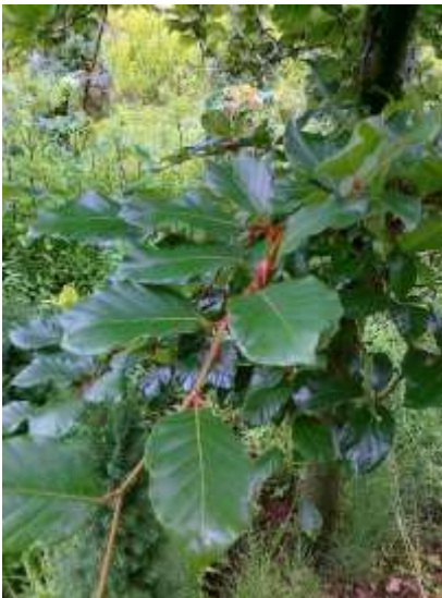
Fagus sylvatica bukev

Habitus: listopadno drevo, razprostrte krošnje, h: do 20m, š: do 15m;