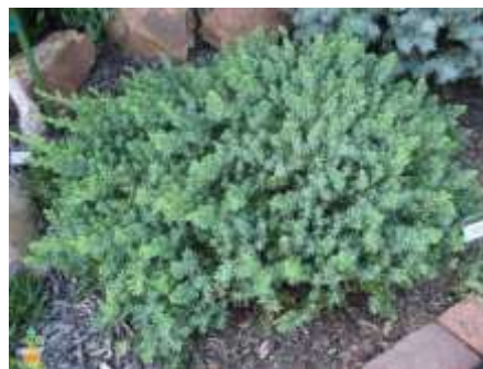
Juniperus squamata 'Blue pacific' brin

Habitus: plazeč iglavec razprostrte rasti, h: 0.3m, š: 1.0m,