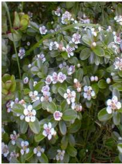
Cotoneaster dammeri 'Coral Beauty' plazeča panešpljica

Habitus: vednozelen gram, h: do 0.6m, š: do 2m; cvet: bel, plod: rdeč