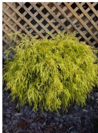
Chamaecyparis p. 'Filifera aurea' pacipresa

Habitus: pokončen iglavec počasne kompaktne rasti, h: 1m, š: 1m,