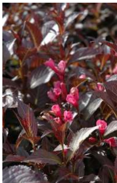
Weigela 'Naomi Campbel' vajgela

Habitus: listopaden grm, razprostrte pokončne rasti, h: 2m, š: 2m, cvet: temno lila-rdeč (junij/julij)