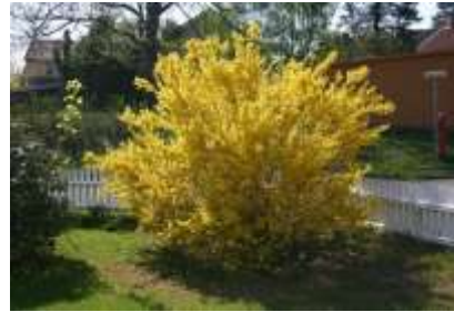
Forsythia intermedia forzicija

Habitus: listopaden grm, pokončne rasti, h: do 3m, š: do 3m; cvet: rumen