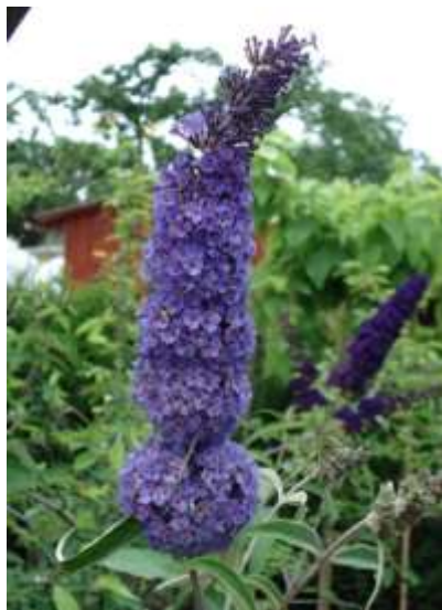
Buddleja davidii 'Empire Blue' budleja

Habitus: grmovnica z dolgimi poleglimi poganjki h: do 3m, š: do 3m;