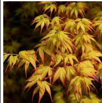
Acer palmatum 'Katsura' japonski javor

Habitus: listopadno nižje drevo ali grm, več debelna dežnikasta krošnja, h: 2,5-4m, š: 2,5-4m;