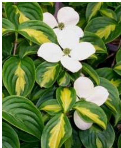
Cornus kousa 'Gold star' Pisani kitajski dren

Habitus: listopaden grm, razprostrte rasti, h: 2,5m, š: do 2m; cvet: rožnato bel; listi zeleno rumeni