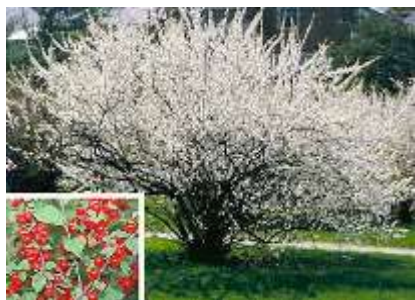
Prunus tomentosa kitajska češnja

Habitus: listopadno drevo, razprostrte rasti, h: 2-3m, š: 3-4m; cvet: bel (april)