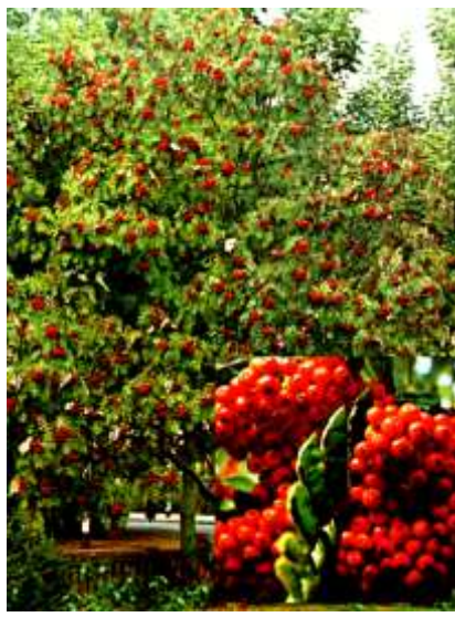
Sorbus aucuparia jerebika

Habitus: listopadno drevo, redke pokončne krošnje, h: 15m, š: 10m,