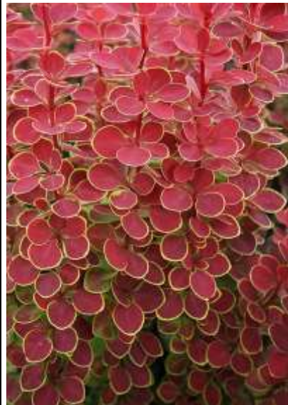
Berberis th. 'Orange sunrise' Pisan rdeči japonski češmin

Habitus: listopadni več debelni grm, h: do 1m, š: do 1m; rumeno rdeči cvet (april/maj)