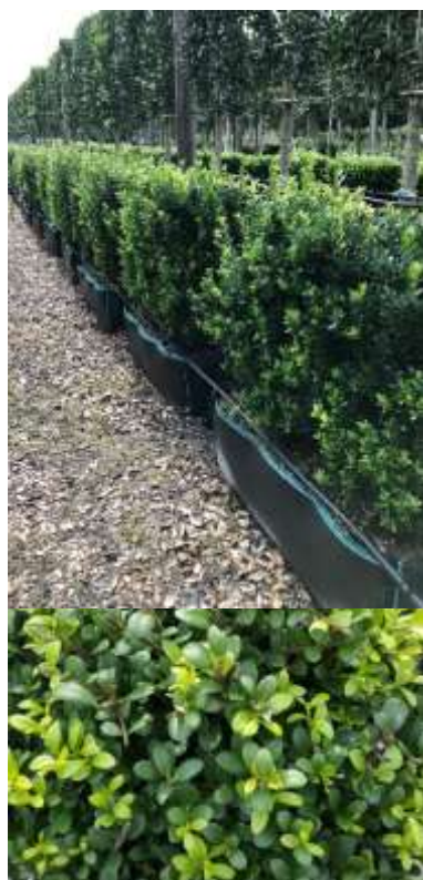
Ilex crenata japonska bodika

Habitus: zimzelen stebrast grm h: 2-4m, š: 2-3m; cvet: bel, plod: črna jagoda