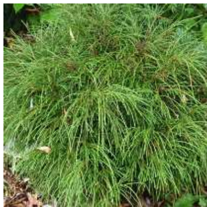
Thuja plicata 'Whipcord' kroglasti klek

Habitus: iglavec kroglaste rasti, h: 1.2-1.5m, š: 1.2-1.5m,