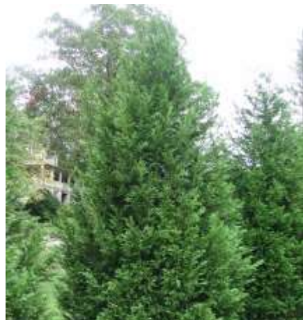
Cupressocyparis leylandii lejlandova pacipresa

Habitus: pokončen iglavec s stožčasto do stebrasto krošnjo in povešanim vrhom, h: 15m, š: 5m,