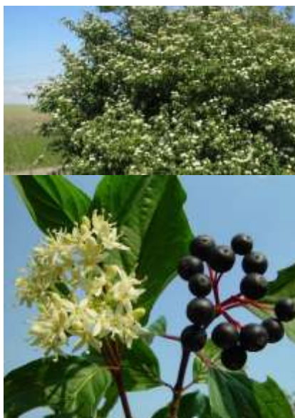
Cornus sanguinea rdeči dren

950384 20-40cm 5,50€ 950385 80-100cm 9,00€ 950386 100-120cm 14,00€