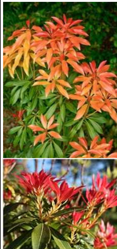
Pieris japonica 'Forest Flame' pjeris-katsura

Habitus: zimzelen grm, košate rasti, h: 1.5m, š:1.5m; cvet: bel