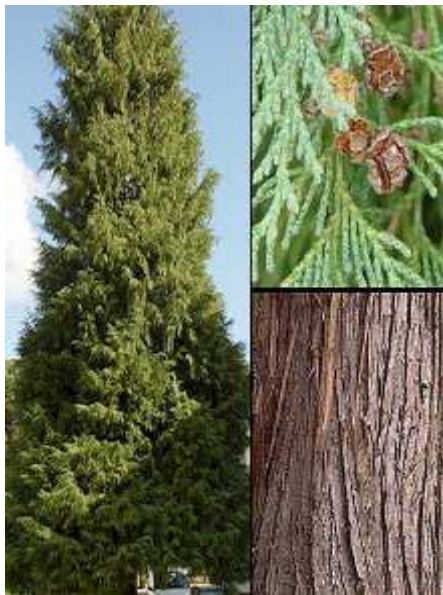
Chamaecyparis lawsoniana lavsonova pacipresa

Habitus: pokončen iglavec s stebrasto krošnjo in povešanim vrhom, h: 15m, š: 5m,