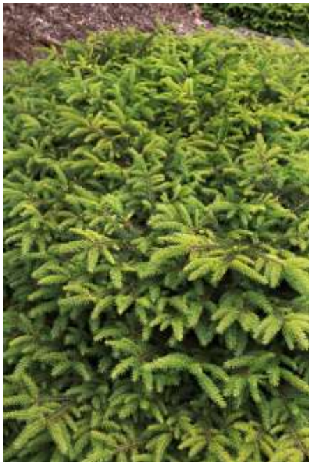
Picea abies 'Nidiformis' grmičasta smreka

Habitus: iglavec kompaktne grmičaste izredno počasne rasti, h: 1,2m, š: 1,5m,