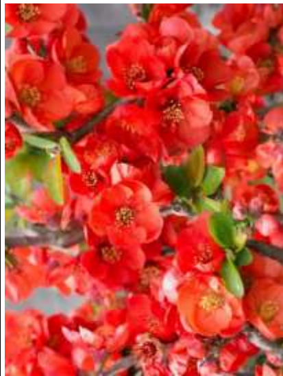
Chaenomeles superba 'Texas scarlet' japonska kutina

Habitus: listopaden grm, razprostrte rasti, h: do 1.2m, š: do 1.5m; cvet: rdeč (april/maj), plod: rumen