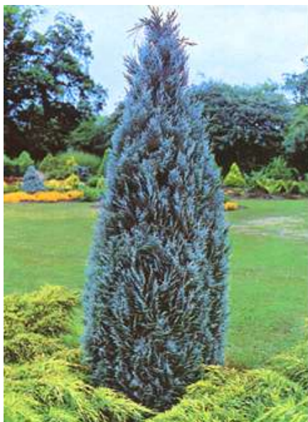
Chamaecyparis l. 'Columnaris Glauca' pacipresa

Habitus: pokončen iglavec s stebrasto krošnjo in povešanim vrhom, h: 8m, š: 3m,