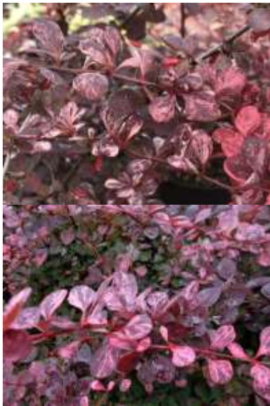
Berberis th. 'Pink queen' pisan rdeči japonski češmin

Habitus: listopadni več debelni grm, h: do 1m, š: do 1m; rumeno rdeči cvet (april/maj)