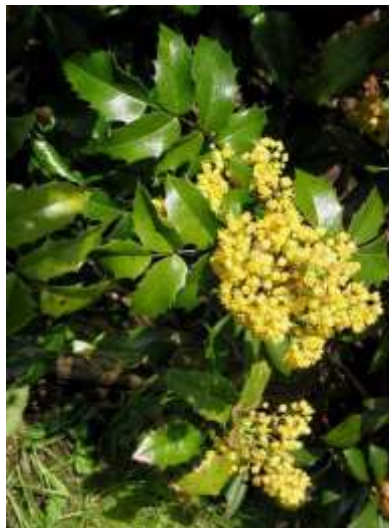
Mahonia aquifolium mahonija

Habitus: zimzelen grm, redka krošnja, h: 1.5m, š: 1.5m; cvet: rumeno socvetje, plod: modro črna jagodasta soplodja