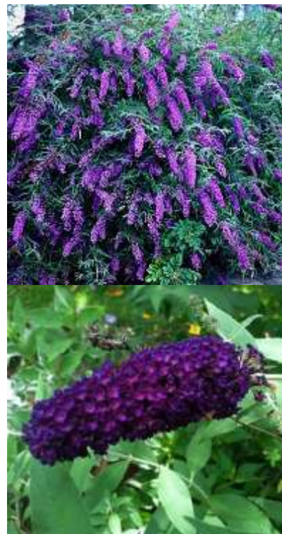
Buddleja davidii 'Black night' budleja

Habitus: grmovnica z dolgimi poleglimi poganjki h: do 3m, š: do 3m;