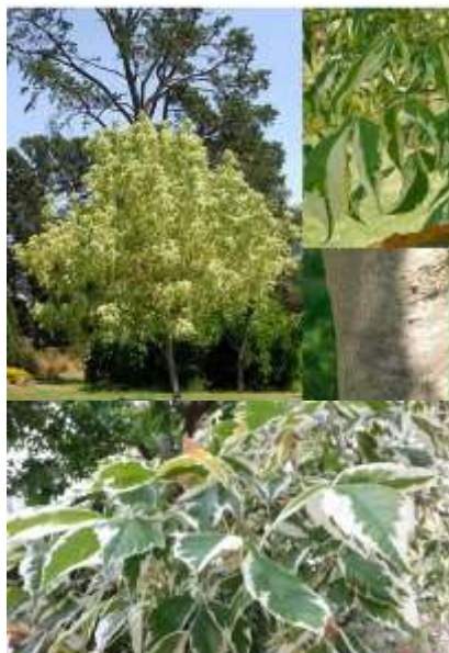
Acer negundo 'Variegatum' ameriški javor

Habitus: listopadno drevo razprostrte krošnje, h: 5-7m, š: 4-6m; listi rožnato belo zeleni