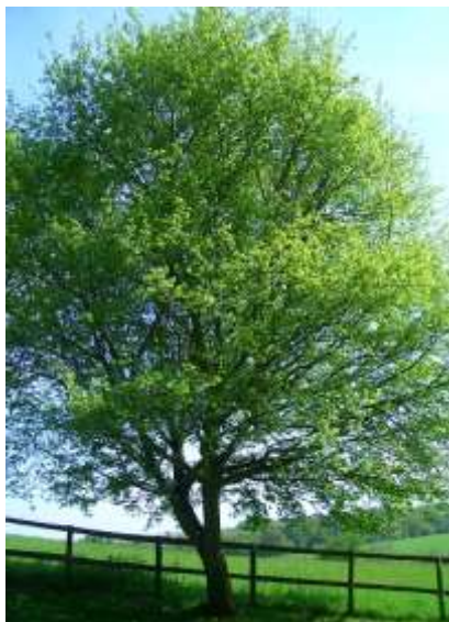
Acer campestre maklen

Habitus: listopadno drevoredno drevo, ovalne krošnje, h: 5-15m, š: 5-10m