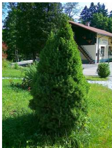
Picea glauca 'Conica' - stožčasta smreka

Habitus: iglavec izrazito stožčaste rasti, h: 2m, š: 1m,