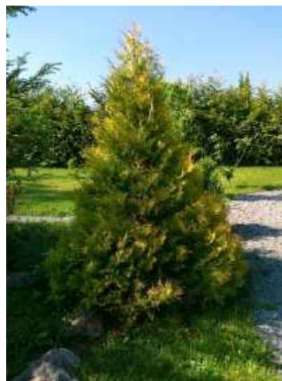
Thuja occidentalis 'Rheingold' klek

Habitus: iglavec široke stožčaste rasti (v mladosti kroglast), h: 2m, š: 1.5m,