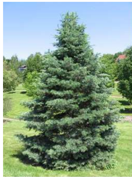
Abies concolor koloradska jelka

Habitus: iglasto drevo, rahlo stožčaste rasti (veje izraščajo vodoravno);