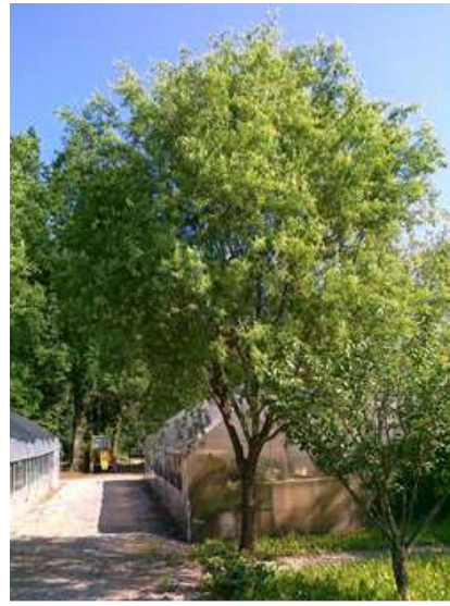
Salix contorta kodrava vrba

Habitus: listopadno drevo, goste pokončne krošnje, h: 12m, š: 10m,