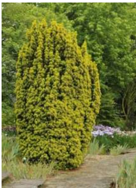
Taxus baccata aurea Zlata tisa

Habitus: manjše iglasto drevo ali višji grm , h: 10 m, š: 8m,