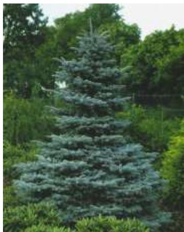
Picea pungens bodičasta smreka

Habitus: iglavec široke stožčaste rasti, h: 15m, š: 6m,