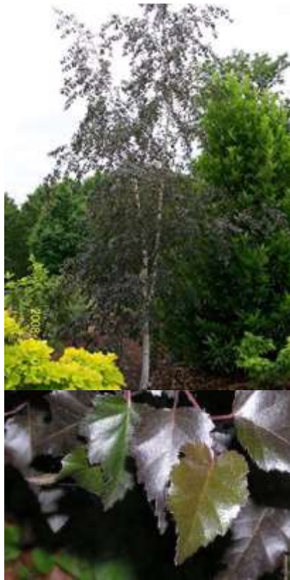
Betula p. 'Purpurea' rdeča breza

Habitus: listopadno drevo, ovalne krošnje, h: 6 do 8m, š: 4 do 7m; rdeče rjava skorja