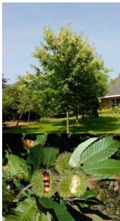
Castanea sativa Domači kostanj

Habitus: listopadno drevo h: 20m, š: 10m;