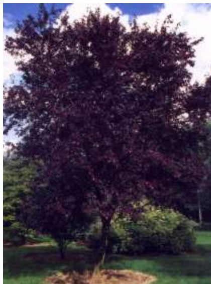
Prunus cerasifera 'Nigra' okrasna sliva

Habitus: listopadno drevo, razprostrte rasti, h: 5-7m, š: 3-6m; cvet: svetlo roza (april)