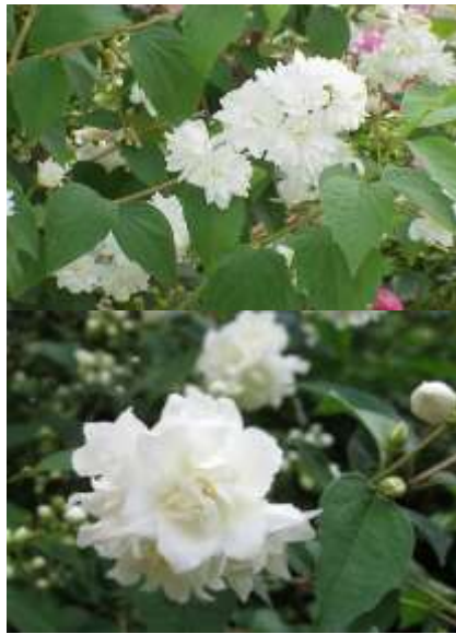
Philadelphus virginialis nepravi jasmin

Habitus: listopaden grm, pokončne, košate rasti, h: 2-3m, š:2-3m; cvet: bel