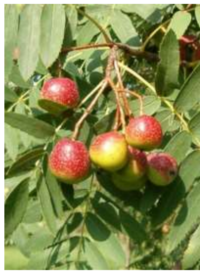
Sorbus domestica skorš

Habitus: listopadno drevo, redke pokončne krošnje, h: 20m, š: 10m,