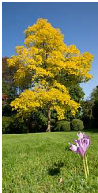
Robinia pseudoacacia 'Frisia' robinija

Habitus: listopadno drevo, razprostrte redke krošnje, h: 8-10m, š: 5-8m,