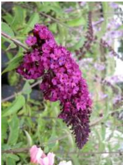
Buddleja davidii 'Fascinating' budleja

Habitus: grmovnica z dolgimi poleglimi poganjki h: do 3m, š: do 3m;