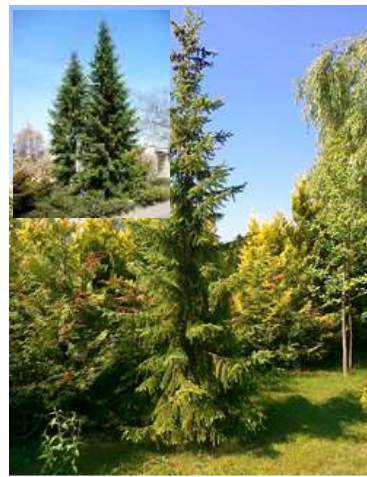
Picea omorika pančičeva smreka

Habitus: iglavec izrazito ozke stožčaste rasti, h: 15m, š: 3m,