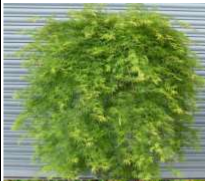
Acer palmatum 'Emerald lace' pahljačasti javor

Habitus: listopadno drevo, povešena dežnikasta krošnja, h: 2-3m, š: 2m;