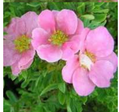
Potentilla fruticosa 'Lovely pink' petoprstnik

Habitus: listopaden grm, košate rasti, h: 0.6-0.9m, š: 0.6-0.9m; cvet: roza (junij- september)