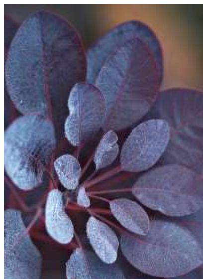
Cotynus coggygia 'Royal Purple' rdeče listni ruj

Habitus: listopaden grm, razprostrte rasti, h: do 3m, š: do 3m; cvet: rumeno zelen - metlast