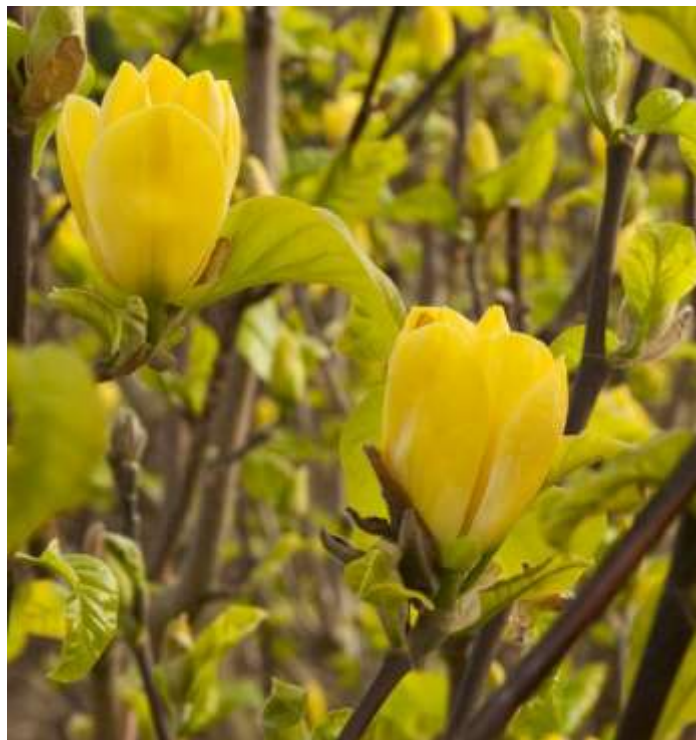
Magnolia Yellow Bird