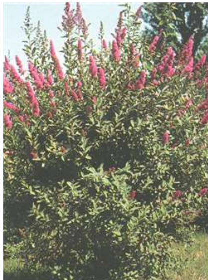
Spiraea billardii medvejka

Habitus: listopaden grm, goste rasti z pokončnimi poganjki, h: 2.5m, š: 2.5m, cvet: temno roza (julij/avgust)