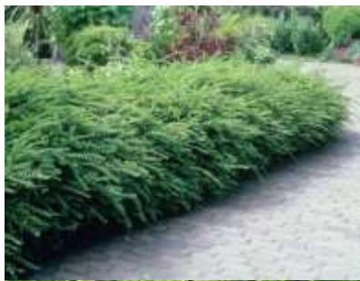
Lonicera nitida kostoničevje

Habitus: delno zimzelen grm, goste in košate krošnje, h: 2m, š: 3m; cvet: bel, plod: lila