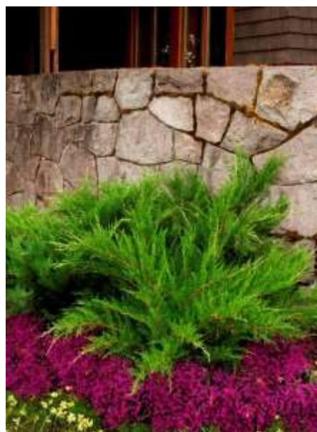
Juniperus media 'Mint Julep ' brin

Habitus: grmast iglavec razprostrte rasti, h: 0.4m, š: 1.2m,