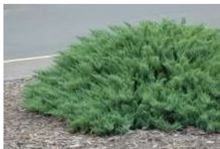
Juniperus sabina 'Tamariscifolia' brin

Habitus: grmast iglavec razprostrte rasti, h: 2 m, š: 2m,