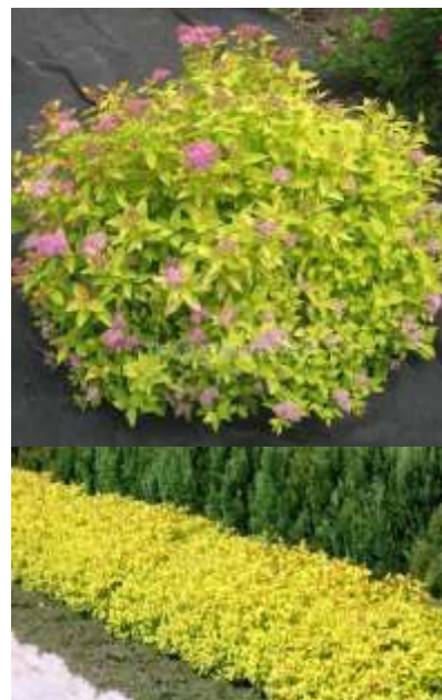
Spiraea japonica Golden princess medvejka

950569 80-100cm 18,00€ 950570 100-120cm 22,00€