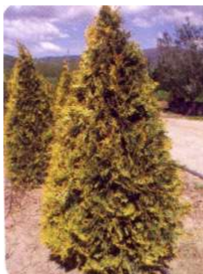
Thuja o. 'Recumbens nana' klek

Habitus: iglavec stožčaste rasti, h: 2m, š: 2.5m,