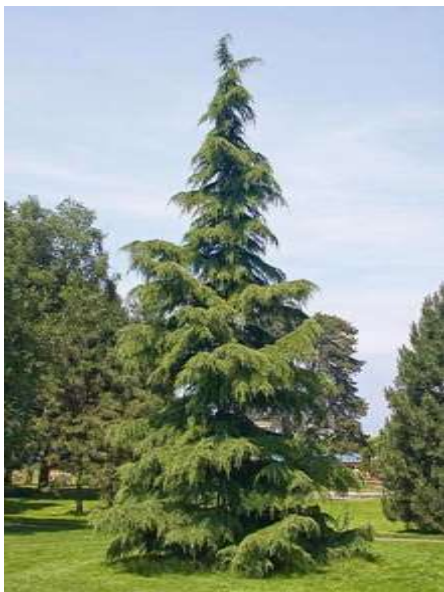
Cedrus deodara himalajska cedra

Habitus: iglasto drevo, goste široke stožčaste krošnje, h: 15m, š: 9m,