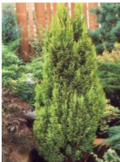
Chamaecyparis l. 'Ellwood's Gold' pacipresa

Habitus: pokončen iglavec počasne rasti z ozko stebrasto krošnjo, h: 3m, š: 0.6-1m,