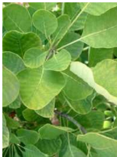
Cotynus coggygia Corymbosus

Habitus: listopaden grm, razprostrte rasti, h: do 4m, š: do 4m; cvet: rumeno zelen - metlast