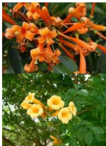
Bignonia sp. (Campsis sp.) jasminova troba

Habitus: listopadni vzpenjavi grmi, h: 5-6m, cvet: bel, oranžen, rumen, rdeč, pisan (po sortah) (julij/avgust)