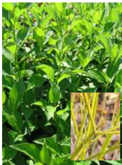
Cornus stolonifera 'Flaviramea' dren

Habitus: listopaden grm, razprostrte rasti, h: do 3m, š: do 3m; cvet: zeleno bel; zeleni listi, svetlo zelena stebila