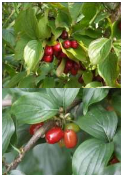
Cornus mas dren

Habitus: listopaden grm, razprostrte rasti, h: do 4m, š: do 3m; cvet: rumen; zeleni listi, rjavo zelena stebila