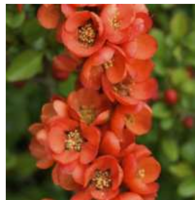
Chaenomeles japonica japonska kutina

Habitus: listopaden grm, razprostrte rasti, h: do 1.5m, š: do 2m; cvet: rdeč ali oranžno-rdeč (april/maj), plod: rumen