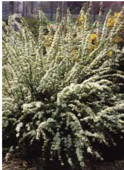
Spiraea arguta medvejka

Habitus: listopaden grm, goste rasti z upognjenimi poganjki, h: 2m, š: 2m, cvet: bel (april/maj)