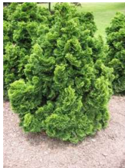
Chamaecyparis obtusa 'Nana gracilis' pacipresa

Habitus: kroglasti iglavec izredno počasne rasti z, h: 1m, š: 1m,