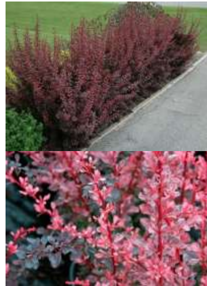
Berberis th. 'Rose glow' Pisan rdeči japonski češmin

Habitus: listopadni več debelni grm, h: do 1.5m, š: do 1.5m; rumeno rdeči cvet (april/maj)