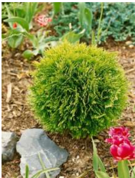
Thuja occidentalis 'Danica aurea' kroglasti klek

Habitus: iglavec zbite kroglaste rasti, h: 0.6m, š: 0.6m,