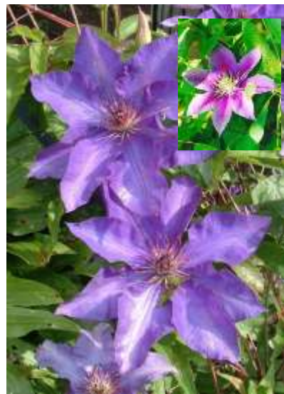
Clematis sp. okrasni srobot

Habitus: listopadni vzpenjavi grmi, h: 3-6-8m, cvet: bel, rumen, moder, roza, lila, pisan (po sortah IV-IX)