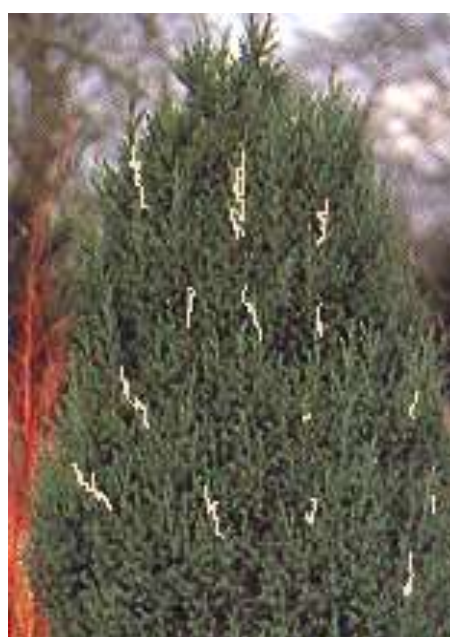
Juniperus media 'Stricta variegata ' brin

Habitus: grmast iglavec valjaste rasti, h: 2m, š: 1m,