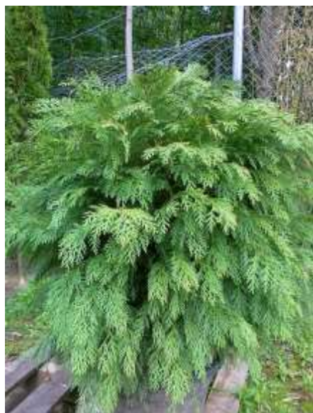
Chamaecyparis I. 'Minima Glauca' pacipresa

Habitus: kroglasti iglavec počasne rasti, h: 1-1.5m, š: 1-1.5m,