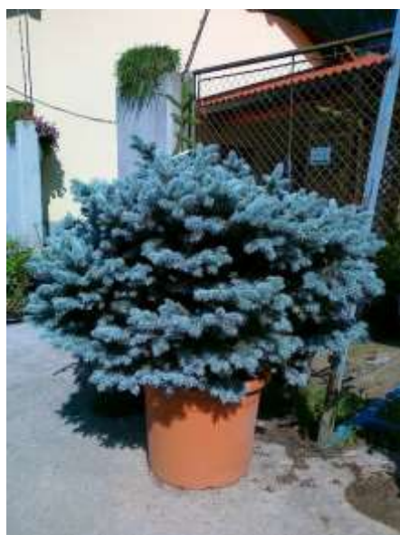
Picea pungens 'Glauca Globosa' grmičasta srebrna smreka

Habitus: iglavec grmičaste rasti, h: 1.5m, š: 1.15m,