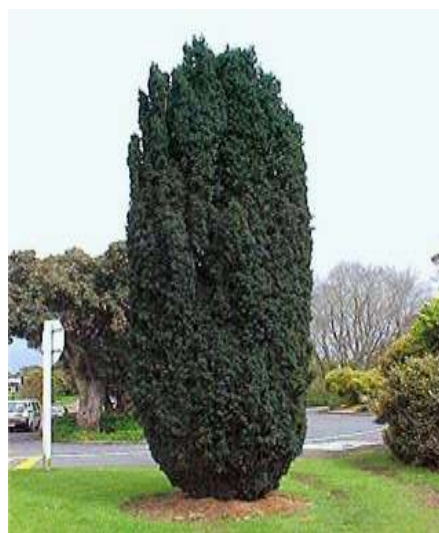
Taxus baccata 'Fastigiata' stebrasta tisa

Habitus: iglavec stebraste rasti, h: 4-7m, š: 1.5-2.5m, Lega: svetla senca, polsenca