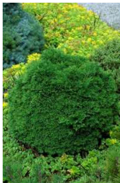
Chamaecyparis L. 'Green globe' pacipresa

Habitus: kroglasti iglavec izredno počasne rasti, h: 0.5m, š: 0.5m,