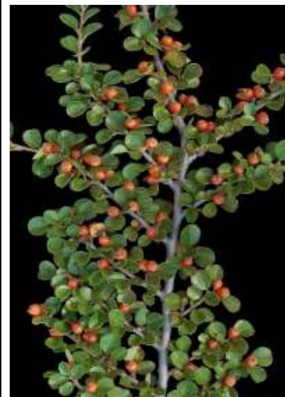
Cotoneaster horizontalis pahljasta panešpljica

Habitus: listopaden gram, razprostrte krošnje h: do 1m, š: do 2m; cvet: bel, plod: rdeč