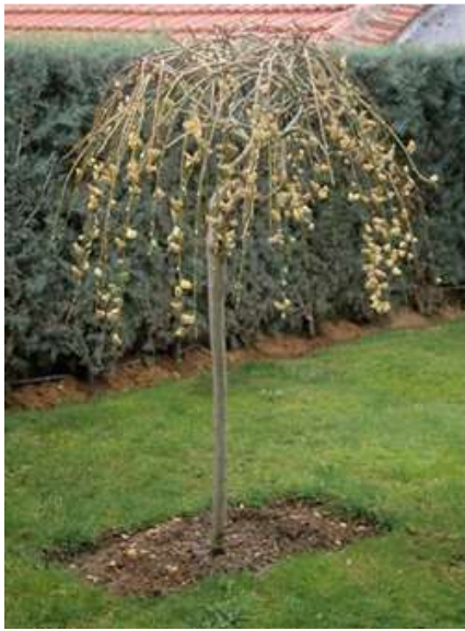
Salix caprea 'Kilmarnoch' Povešava vrba

Habitus: listopadno drevo, goste povešave krošnje, h: 1.8m, š: 1.5m,