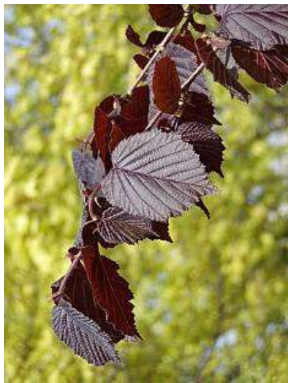
Corylus maxima 'Purpurea' rdeča leska

Habitus: listopaden grm, razprostrte rasti, h: do 5m, š: do 3m;