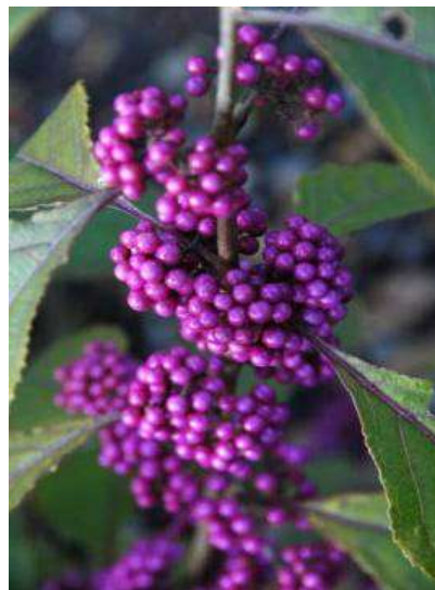
Calicarpa bodinieri 'Profusion' kalikarpa

Habitus: listopaden razprostrt grm, h: 2-3m, š: 2m; cvet:lila, plod: rdeč-viola