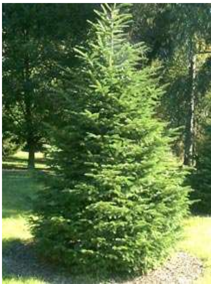
Abies alba navadna jelka

Habitus: iglasto drevo, ozke stožčaste rasti; h: 25m, š: 7m,