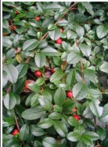
Cotoneaster dammeri 'Skogholm' plazeča panešpljica

Habitus: listopaden gram, h: do 1m, š: do 2m; cvet: bel, plod: rdeč