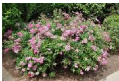
Spiraea japonica 'Little princess' medvejka

Habitus: listopaden grm, goste rasti z pokončnimi poganjki, h: 0.4-0.8m, š:0.8-1.2m, cvet: rdeč-lila (julij/avgust)